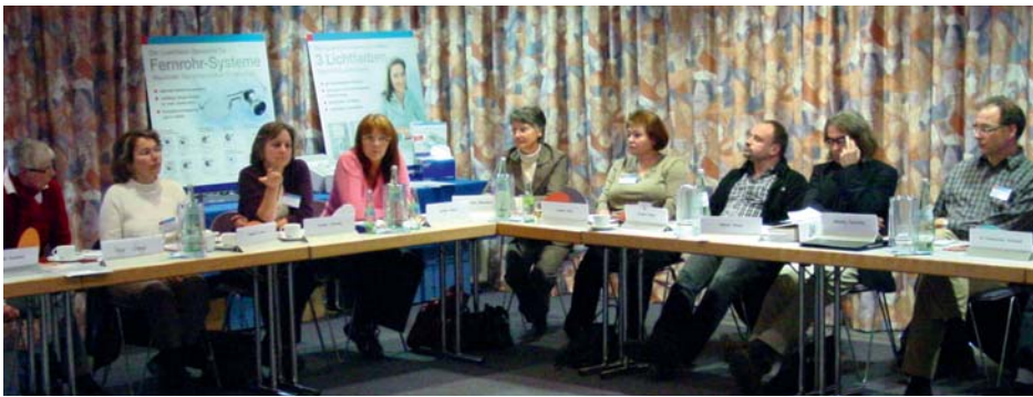
26 Teilnehmer aller Fachdisziplinen der LowVision-Branche trafen sich am 21. Oktober 2009 zum ersten RoundTable von SCHWEIZER.

Riesen Erfolg: RoundTable ++ Neu: Infekt-Protect ++ Hilfe: SCHWEIZER Lupen in Uganda