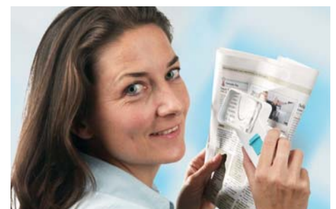
Lupen mit Infekt-Protect-Ausstattung: Eine saubere Sache!