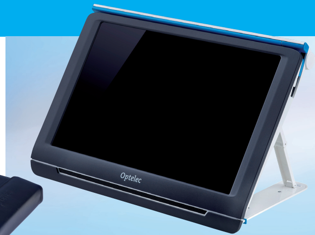
3 Kameras, jeweils mit LED-Beleuchtung